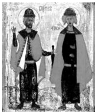
Святые Борис и Глеб. Икона XVI в. Ярославль